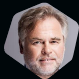
Eugene Kaspersky CEO of Kaspersky

“Polys made it possible to carry out a direct decision making in any organization. We used all of our experience to make a secure and transparent voting tool”