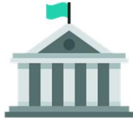
Youth parliament elections