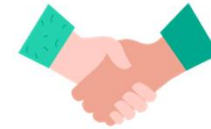
Student union elections